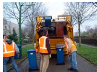
Vorig jaar hielpen ruim 1.400 vrijwilligers van OPA om de papierkloko's te legen.

In alle kernen van de gemeente Houten zamelen de vrijwilligers van scholen en kerken het oud papier in. In Houten en 't Goy gebeurt dit met blauwe papierkloko's en in Schalkwijk en Tull en 't Waal op de "ouderwetse" manier met dozen en zakken. In die dorpen staat ook een grote verzamelcontainer waarin de dorpsbewoners hun papier kwijt kunnen. De komst van de papierkloko heeft ervoor gezorgd dat de vrijwilligers maar liefst één miljoen kilo papier per jaar extra ophalen!